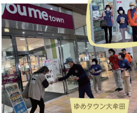
ゆめタウン大牟田