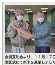
会員互助会より、11月17日表彰式にて新米を贈呈しました