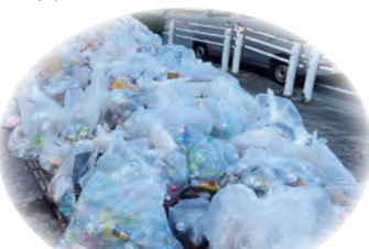
活動終了後、たくさんのゴミがあつまりました!