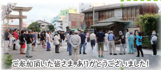
ご参加頂いた皆さま、ありがとうございました!

とき 7月24日(月) 6:00～ ところ 大蛇山祭り会場とその周辺 参加者 88名