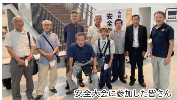
安全大会に参加した皆さん