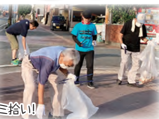
大牟田市長自ら会員さんと一緒にゴミ拾い!