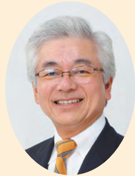
大牟田市長 中尾 昌弘