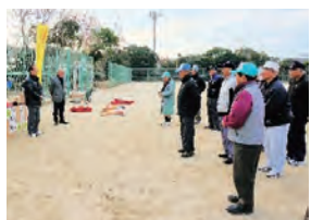
吉岡会長あいさつ