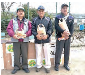
右から1位、2位、3位の方々

十二月十四日(金)、大牟田緑地運動公園において会員互助会恒例のグラウンドゴルフ大会が実施されました。寒空の中、六組二十四人の会員が参加し大変賑わいました。時には励ましたり、からかったりして笑い声が絶えませんでした。結果は左表のとおりです。 豪華商品を用意していただきますので来年はもっとたくさんの方々参加を期待しています。