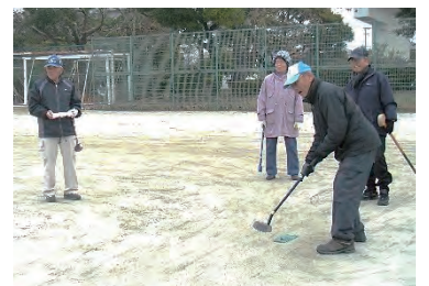
気合を入れて！ 行けっ…