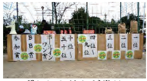
ずらりと並んだ賞品